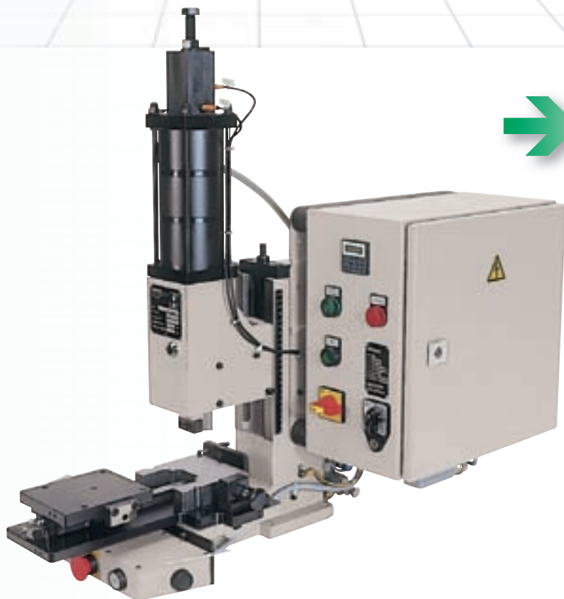
Presse 12 kN LP associée à un feeder HST 150 RB

Avec verrou pneumatique Avec avance / recul pneumatique