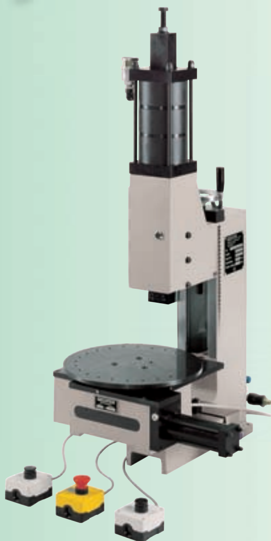
Type 20 kN LP