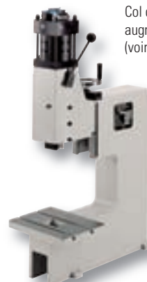
Col de cygne augmenté à 300 mm (voir page 35)

Hauteur de travail augmentée de 100 mm (voir page 34)