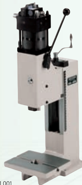
8 kN HKP/L Art. Nr. B3001.001