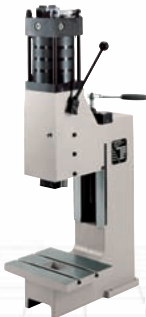
45 kN HKP/L Art. Nr. B7001.001