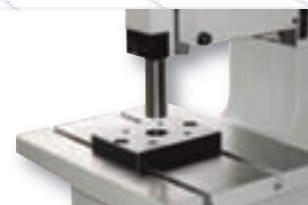
Plaque de centrage

FRL en option, incluant manomètre et mise à l'échappement.