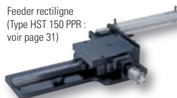
Feeder rectiligne (Type HST 150 PPR : voir page 31)