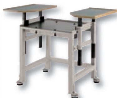
La hauteur des plateaux latéraux est ajustable